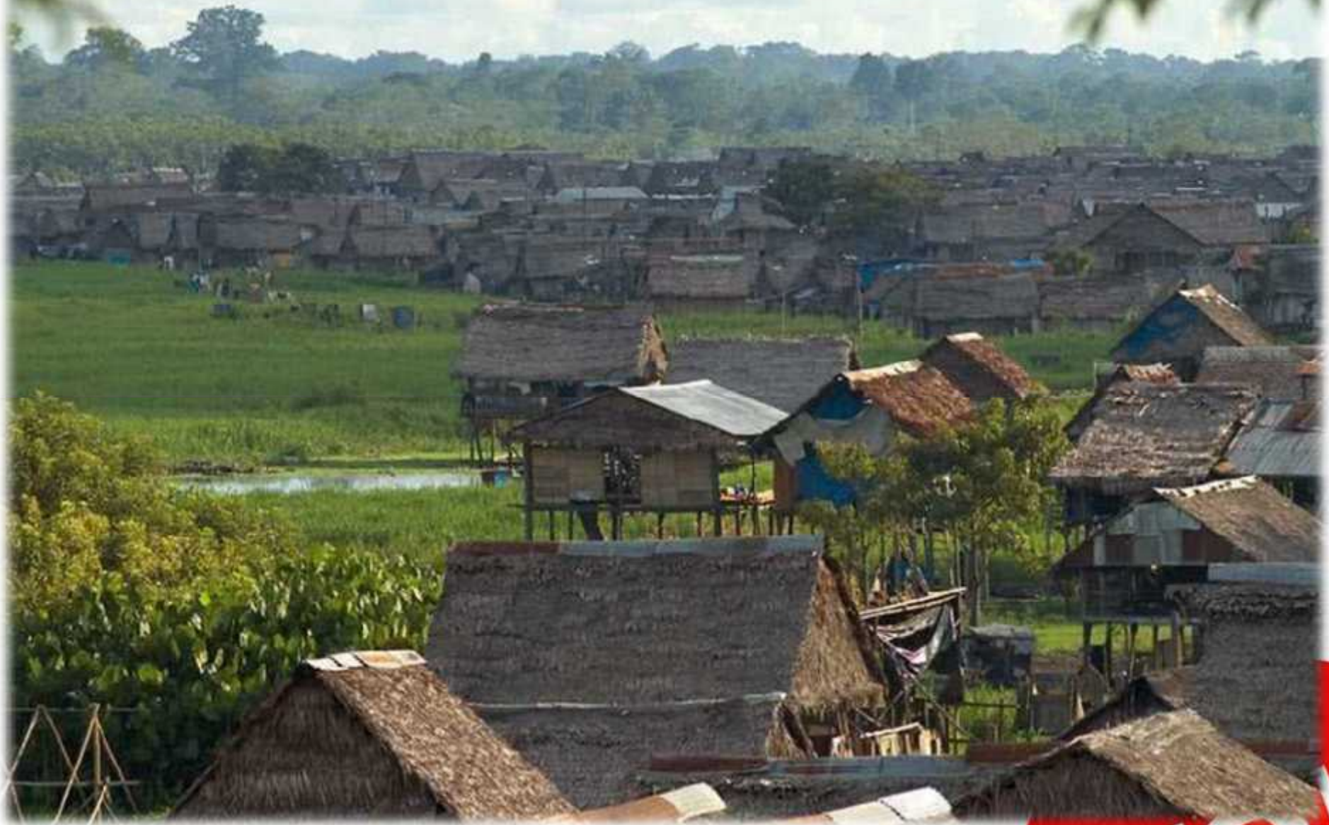
Iquitos - Perú