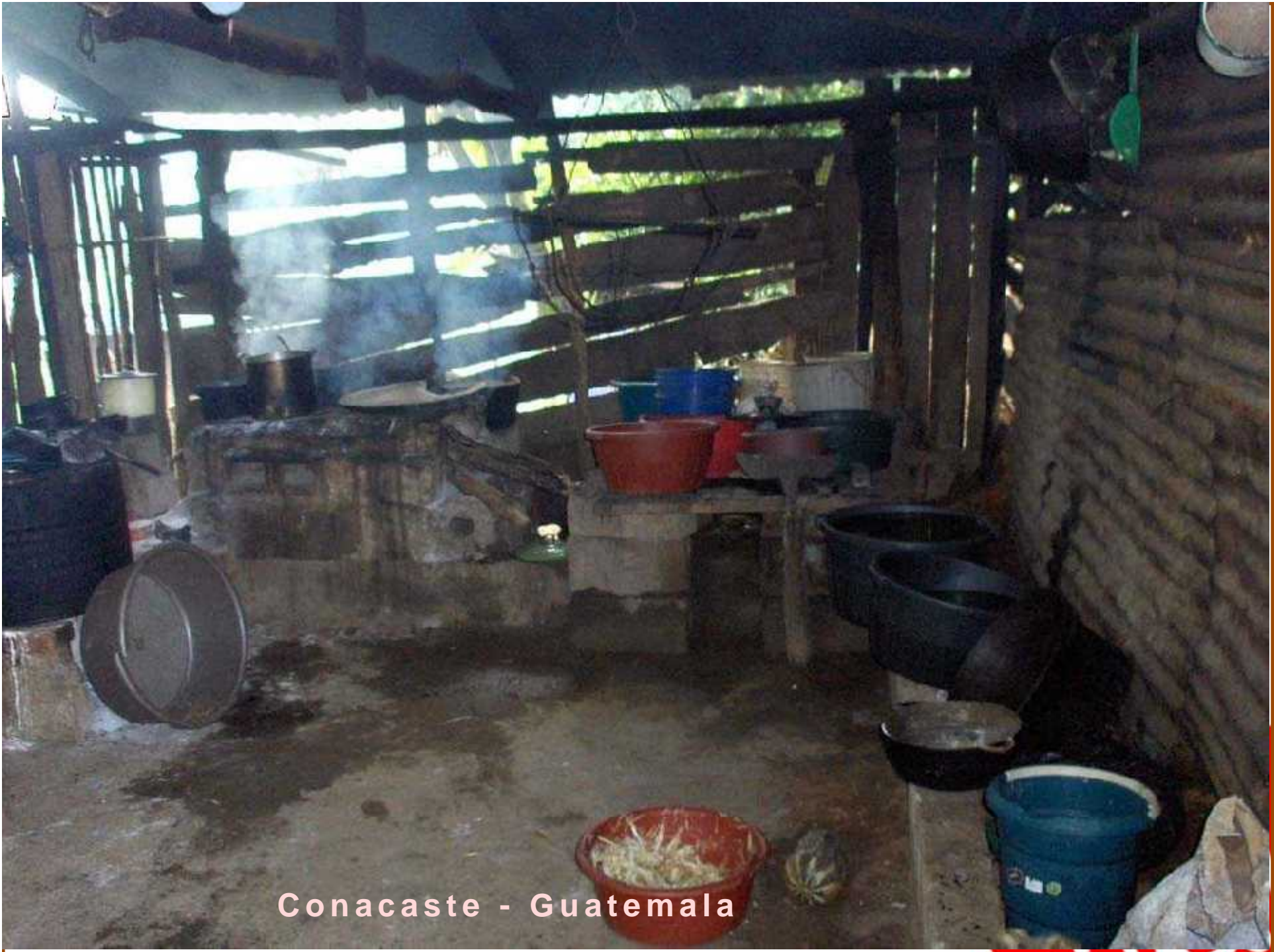
Conacaste - Guatemala