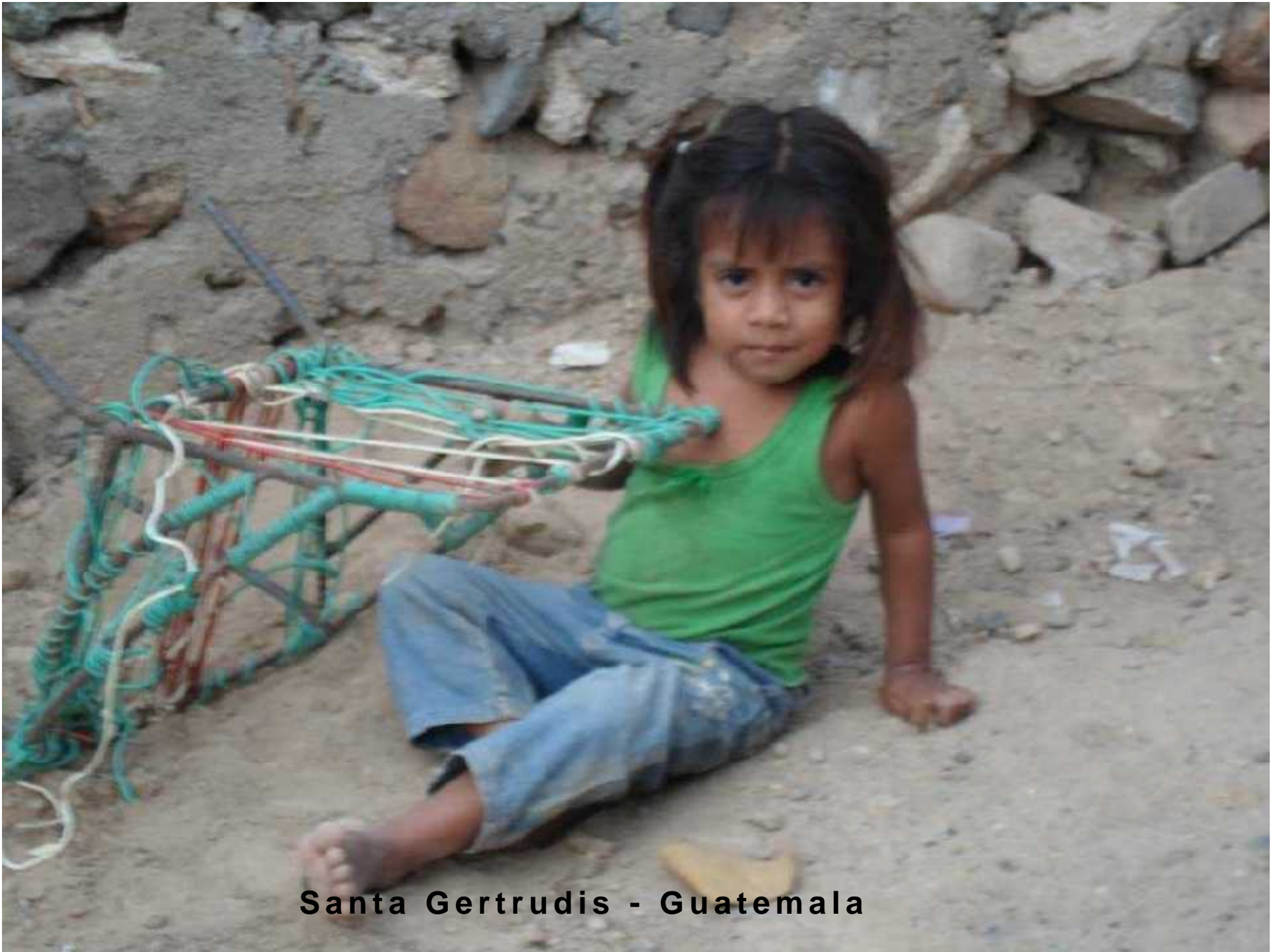
Santa Gertrudis - Guatemala