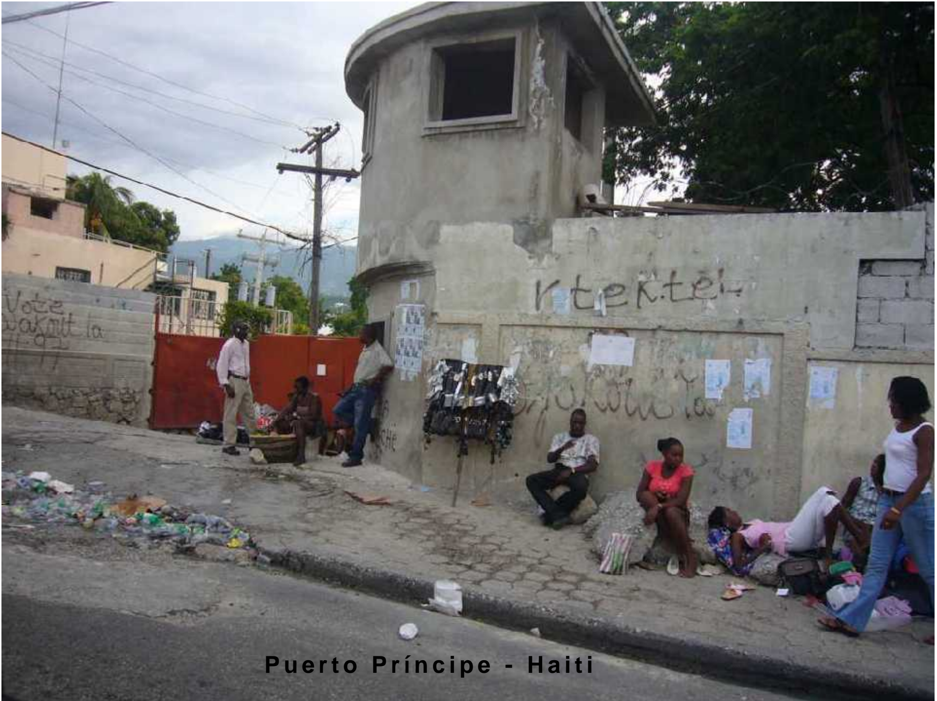
Puerto Príncipe - Haiti